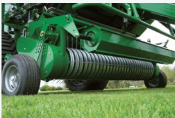
2 m HL Pick Up 5-reihig