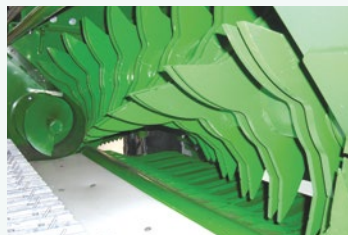
15 Messer Schneidwerk