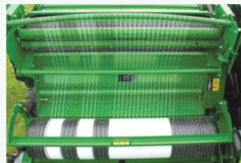
HL Vario Netzbindung